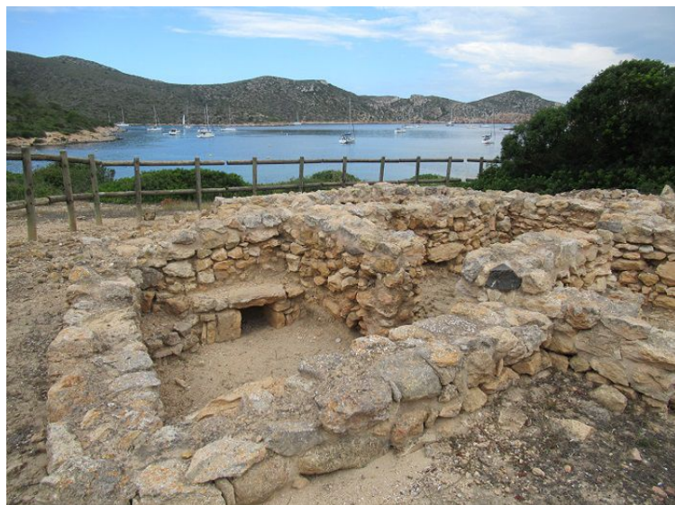
Les ruines de leur habitat

Les militaires peu nombreux sur place, n'ont quitté l'île définitivement qu'en 1999.