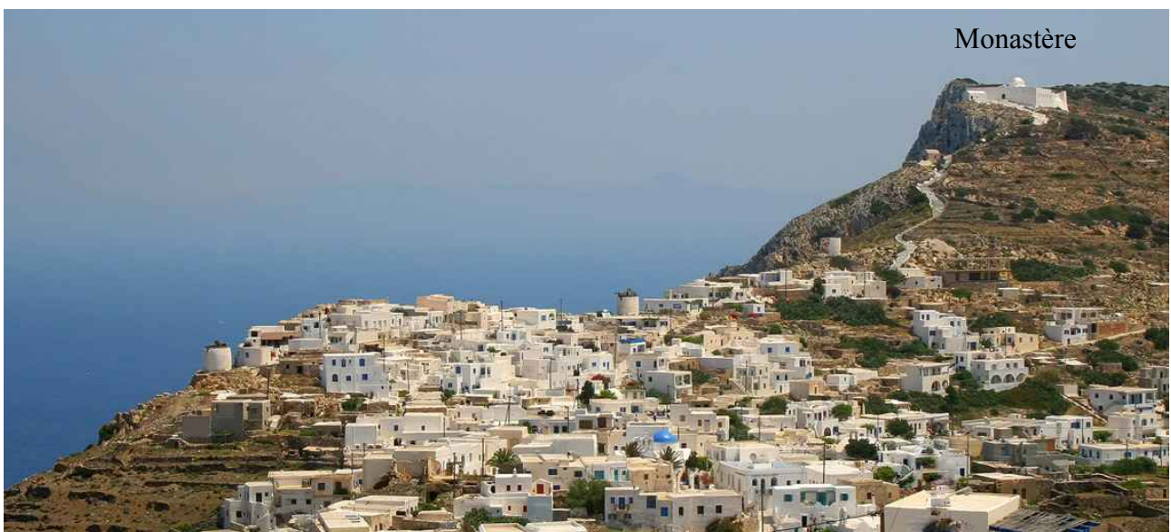
Avis aux amateurs, en tout cas l'île mérite largement une visite.