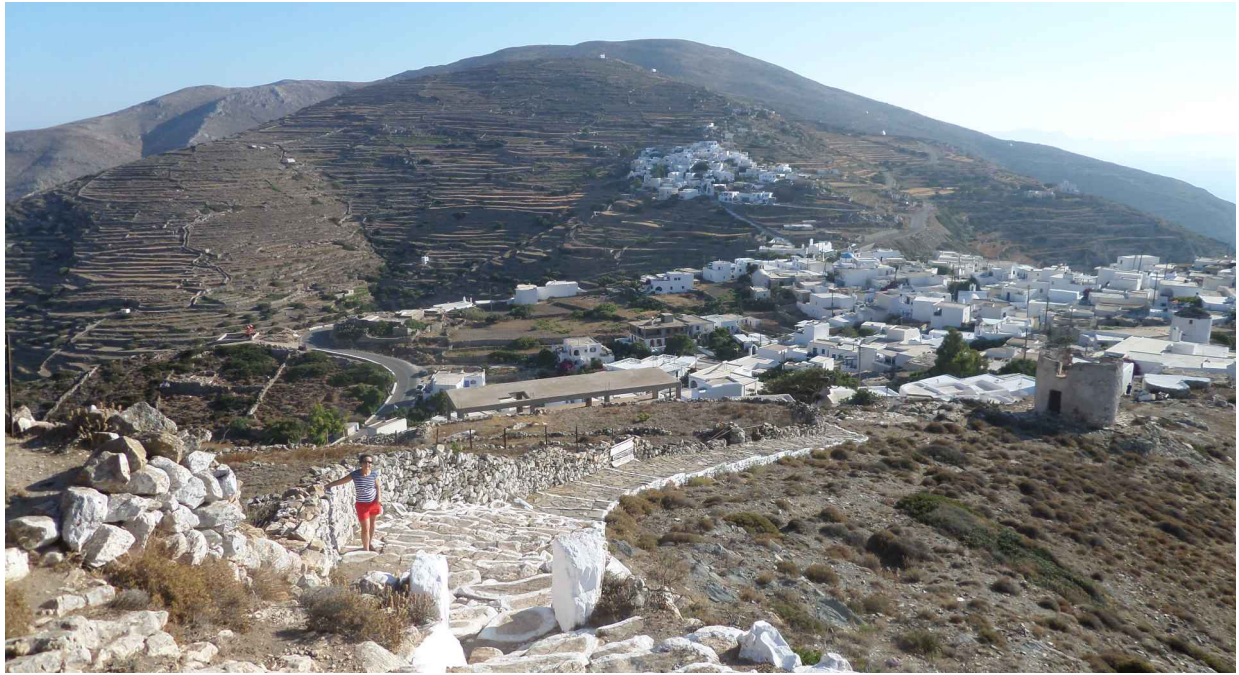
La porte du monastère est ouverte à partir de 18h., et une jeune nonne nous y accueille...