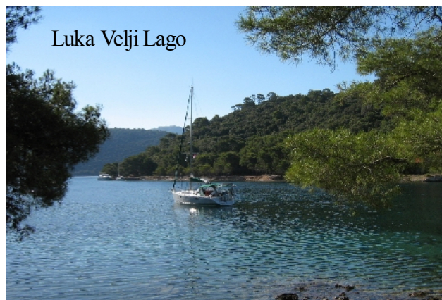
Luka Velji Lago

LUKA VELJI LAGO où une marina est construite. Mais il y a aussi la possibilité de mouiller dans la petite baie NW tb dans un fond de gravier de bonne tenue; il s'agit d'un ancien port militaire et vous voyez le tunnel d'entrée dans la colline (un bateau y était accosté le long du quai à l'extérieur