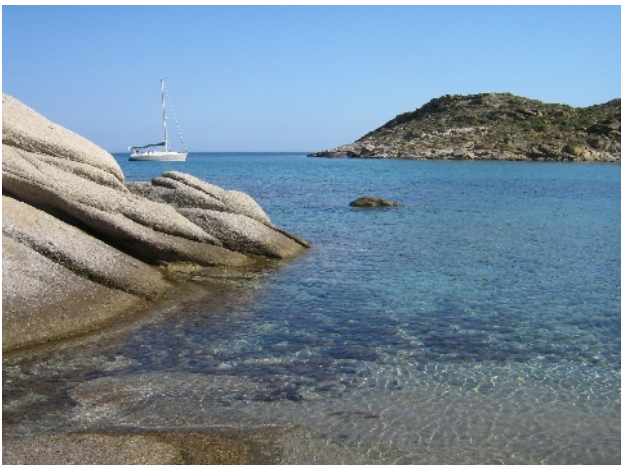
Marina de Naoussa : très bon accueil et pendille