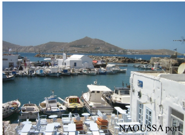
Village sympa,vaut le détour .