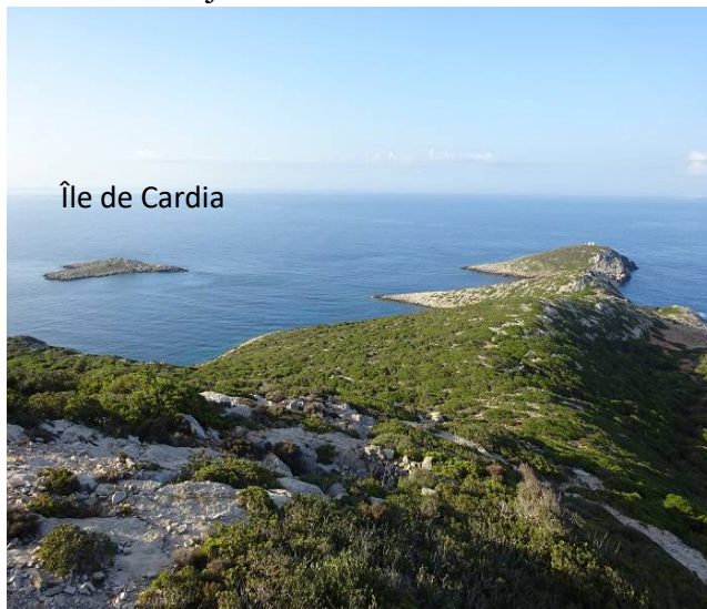
Île de Cardia