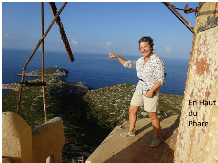
En Haut du Phare

Le bâtiment est malheureusement en décrépitude mais il assure toujours sa fonction.